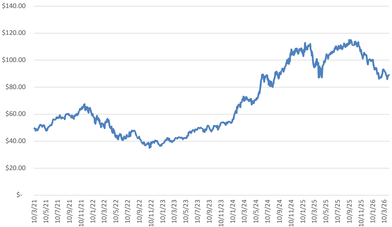
GENIUS21 PRECIOS HISTORICOS

Ticker: GENIUS21 Denominación: MXN Valor Nominal Aprox: $90.46 pesos Fecha de emisión: 10/03/2021 Rebalanceo: Trimestral Tipo de Valor: 1B ISIN: MX1BGE0L0002 Índice: S&P / BMV InGenius Index